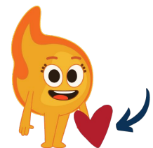
El corazón es cariñoso (hacer un corazón con las manos)