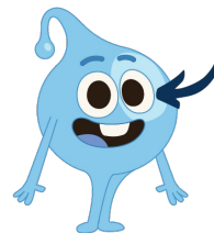
Los ojos están mirando (señala tus ojos)